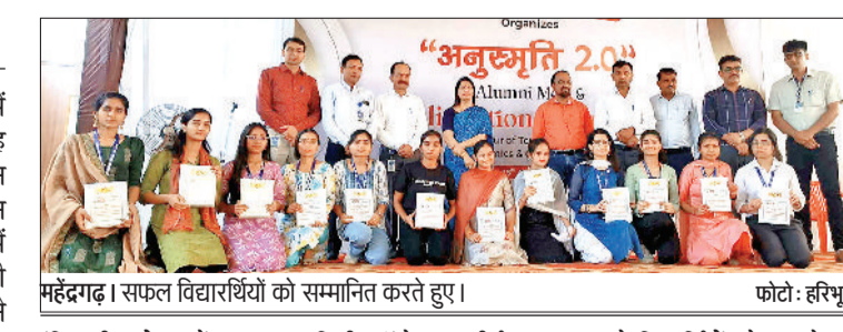
महेन्द्रगढ़। सफल विद्यार्थियों को सम्मानित करते हुए।