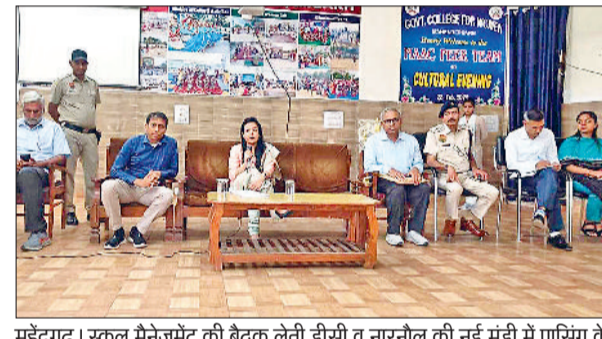
हरिभूमि न्यूज: महेन्द्रगढ़

स्कूल बस हादसे के बाद फिटनेस पर सवाल उठे तो जागा सिस्टम, स्कूल संचालकों को अभिभावकों व बच्चों से चालकों का फीडबैक लेने के निर्देश