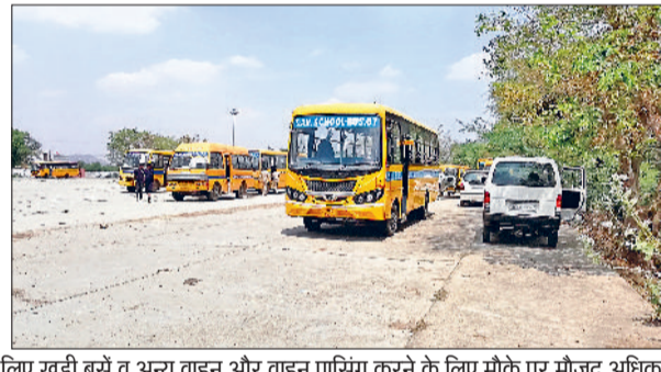
महेन्द्रगढ़। स्कूल मैनेजमेंट की बैठक लेती डीसी व नारनौल की नई मंडी में पारिंग के लिए खड़ी बसें व अन्य वाहन और वाहन पारिंग करने के लिए मौके पर मौजूद अधिकारी।